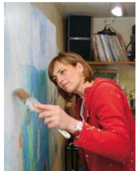
En koncentreret kunstner.