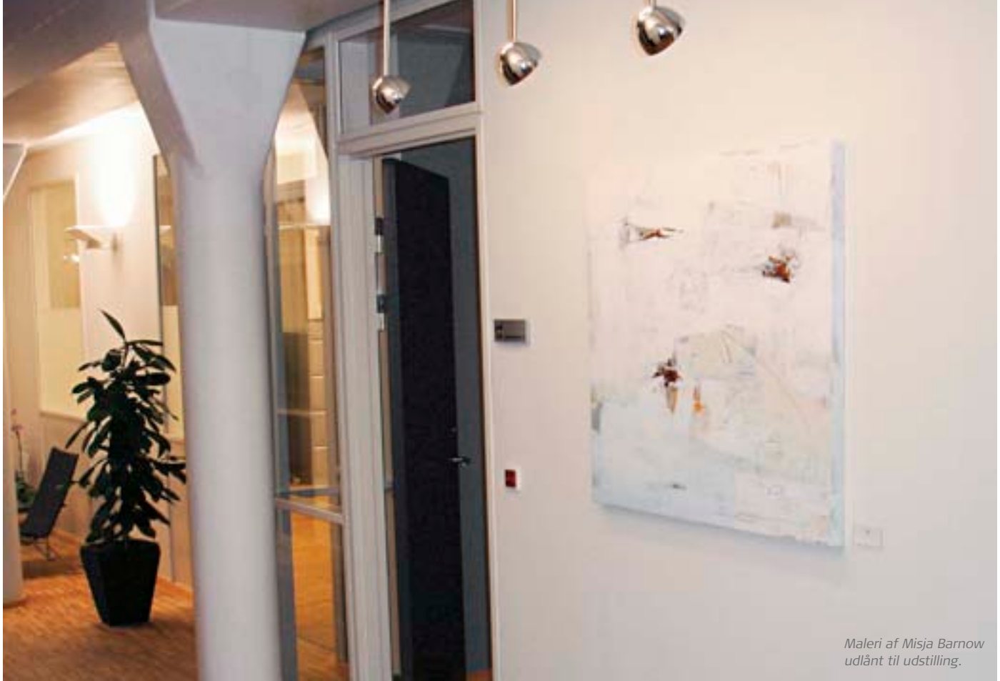
Maleri af Misja Barnow udlånt til udstilling.